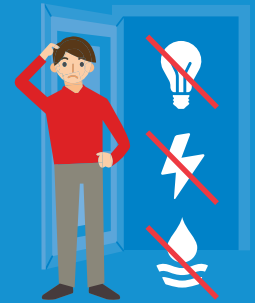
Afsluiting levering gas, electra of water