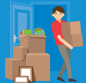
Ontruiming van woning door verhuurder